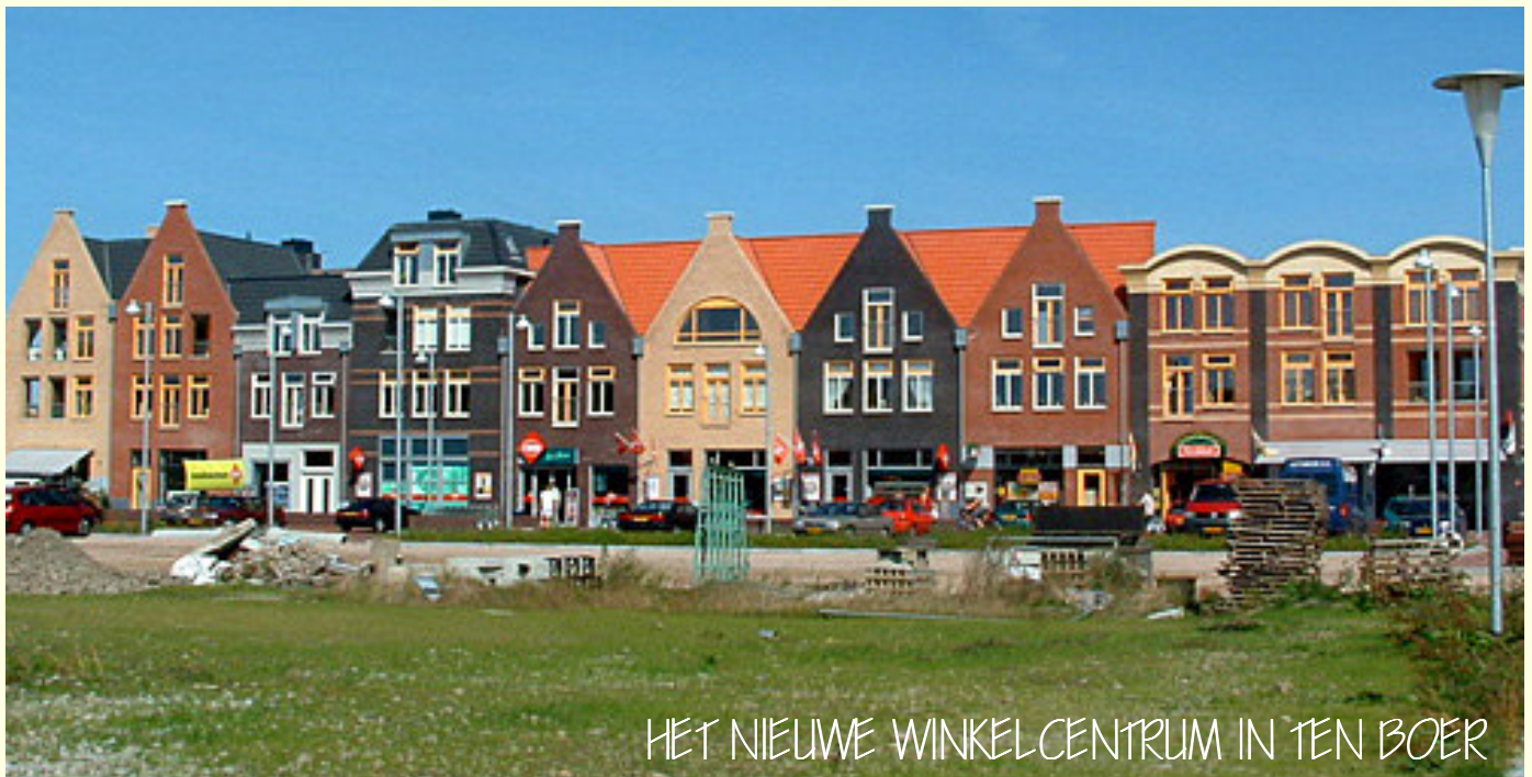
HET NIEUWE WINKELCENTRUM IN TEN BOER