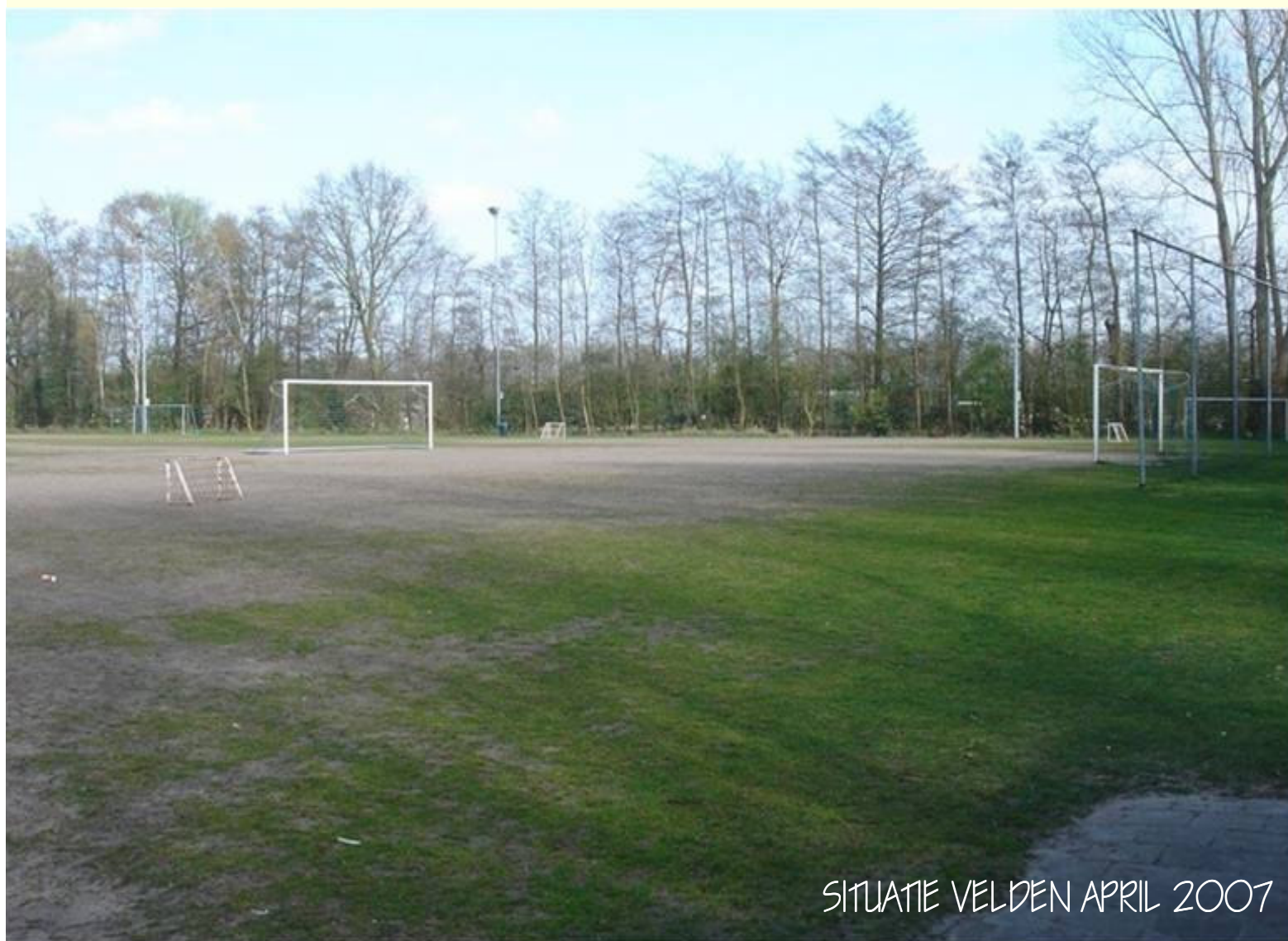
SITUATIE VELDEN APRIL 2007