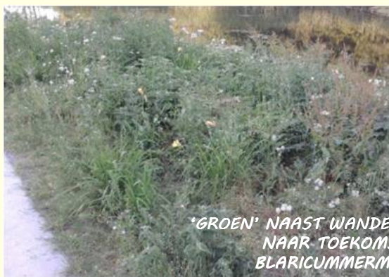
'GROEN' NAAST WANDELPAD NAAR TOEKOMSTIGE BLARICUMMERMEENT