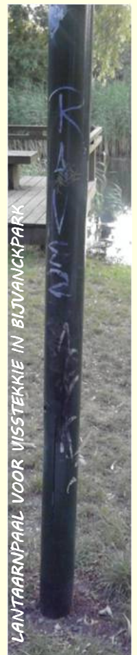
LANTAARNPAAL VOOR VIJSTEKKE IN BIJVANCKPARK