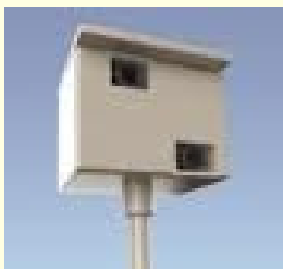
De 'beruchte' flitskast