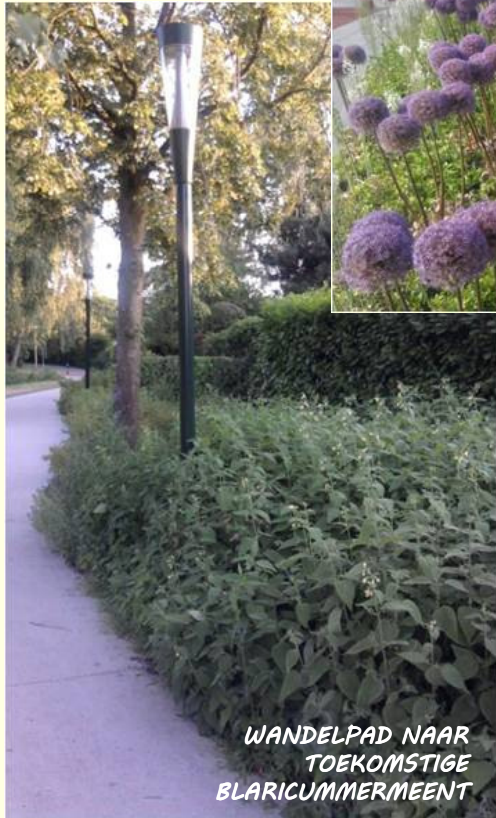
WANDELPAD NAAR TOEKOMSTIGE BLARICUMMERMEENT