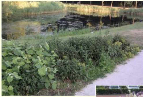
WANDELPAD NAAR TOEKOMSTIGE BLARICUMMERMEENT