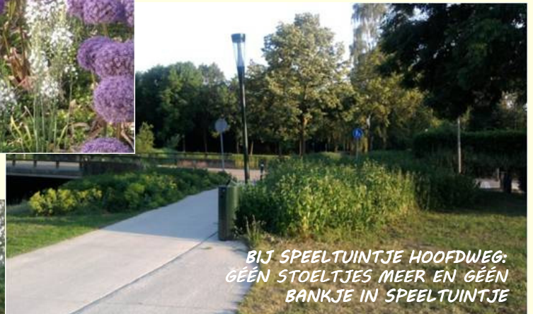
BIJ SPEELTUINTJE HOOFDWEG: GEËN STOELTJES MEER EN GEËN BANKJE IN SPEELTUINTJE