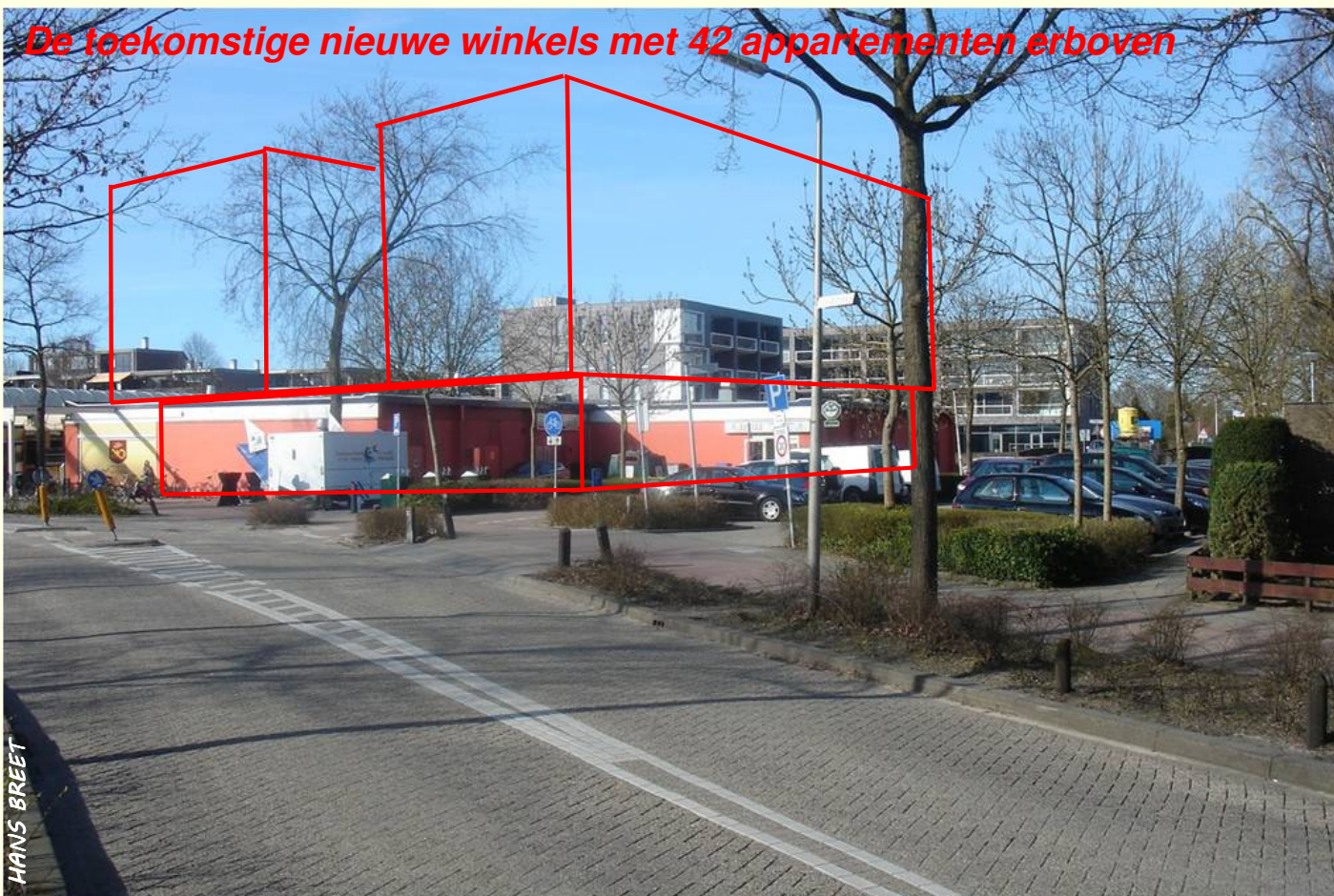
De toekomstige nieuwe winkels met 42 appartementen erboven

Links de zijgevel van de drogisterij / rechts de achtergevels van de overige winkels / erachter de appartementen boven o.a. de Malbak