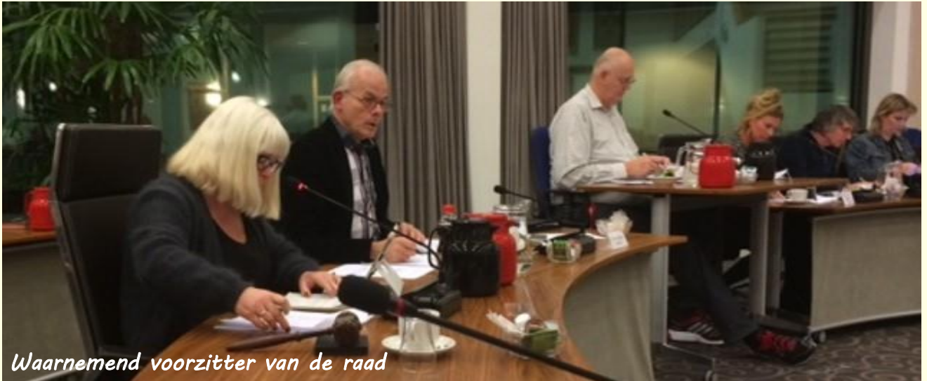
Waarnemend voorzitter van de raad