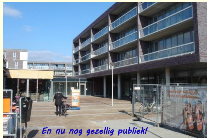
En nu nog gezellig publiek!