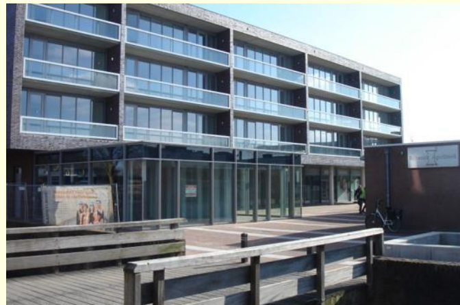
Van 7 t/m 12 maart wordt deze brug vervangen!