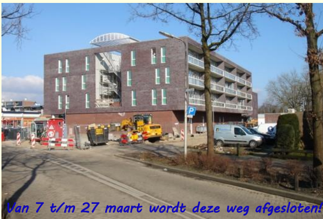
Van 7 t/m 27 maart wordt deze weg afgesloten!

Kijkt u voor meer info op: http://noordersluis.nl/de-balken-in-afrondende-fase/ (red.)