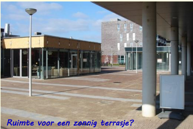
Ruimte voor een zonnig terrasje?