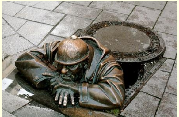
Street Art - Mickey Champion

Door de gemeente Blaricum, Laren, Waterschap Amstel, Gooi en vecht en Rijkswaterstaat is op 28 oktober 2014 een samenwerkingsovereenkomst getekend.