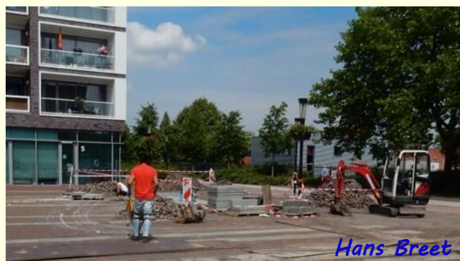
Hans Breet Jeu-de-Boule baan in aanleg