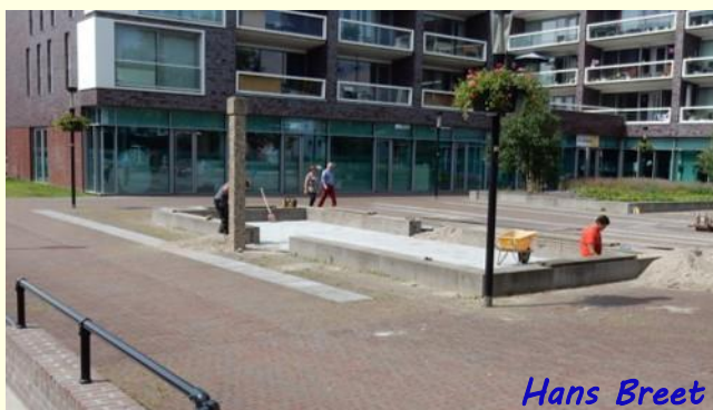
Hans Breet Toekomstige speelplaats

Wilt u 'De Korenbloem' automatisch en gratis digitaal ontvangen, stuurt u dan een eenvoudig verzoekje via de E-mail naar: info@deblaricumsepartij.nl . Opzeggen kan altijd op dezelfde manier.